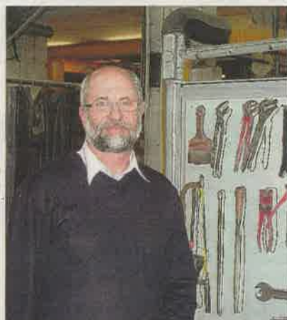
Le dirigeant de RD Technologies a augmenté son chiffre d'affaires outre-Rhin de 80 % en 2010.

Après avoir beaucoup développé l'Italie ces cinq dernières années, la société veynoise poursuivra sa progression sur le marché allemand, le plus gros marché européen, en 2012. L'année passée, RD Technologies a déjà augmenté son chiffre d'affaires de près de 80 % par rapport à 2010 outre-Rhin, soit 700 000 € de chiffre d'affaires. L'entreprise, qui avait d'abord peiné à trouver un réseau commercial au niveau local, a changé d'agent il y a un an. Plus de présence, meilleure perception du marché, offres plus affinées... Cette nouvelle collaboration s'est révélée à ce point satisfaisante que RD Technologies espère encore augmenter de 30 à 40 % la part de l'Allemagne dans son chiffre d'affaires.